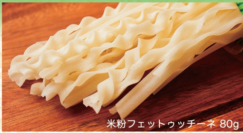
米粉フェットウッチーネ 80g