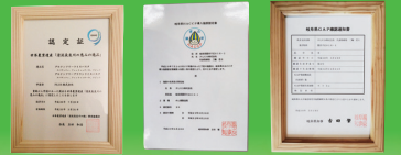
世界農業遺産「清流長良川の恵みの逸品」認定商品

原材料は世界農業遺産認定地域(清流長良川上中流域)にて自社栽培した岐阜県の代表品種ハツシモ米100%を製粉したのみを使用しています。コシのある食感、風味、色はお米ならではの特徴です。小麦粉を一切使用していない、グルテンフリー食品です。