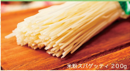
米粉スパゲッティ 200g